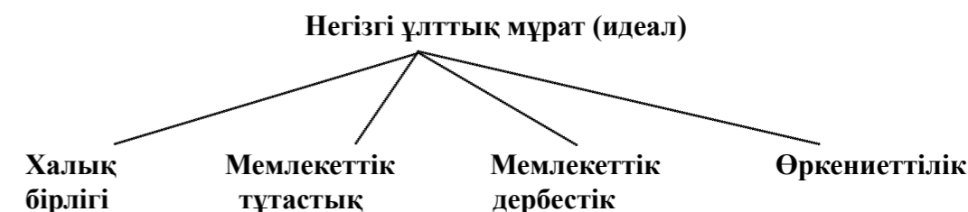
Сызба 2 – Тәуелсіз Қазақстан Президентінің мемлекеттік мұраты

«Тарих толқынында» атты еңбекті ғылыми зерделегенде мемлекет алдындағы негізгі ұлттық мұрат – халық бірлігі, мемлекетіміздің тұтастығы мен дербестігі, ұлттық құндылықтар негізінде өркениетті елдер қатарында болу (Сызба 2)