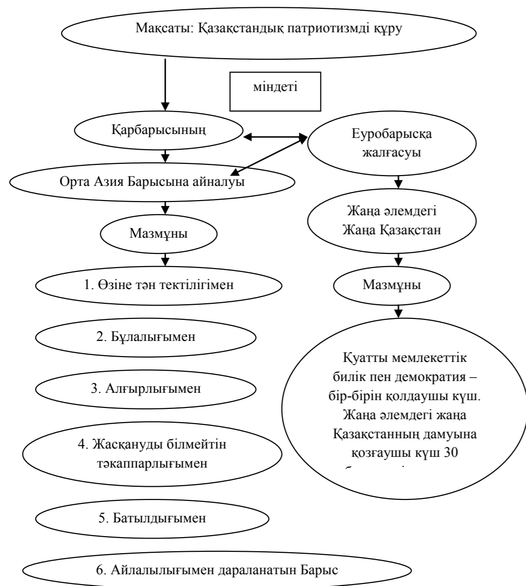
Модель – Қазақстандық патриотизмнің Қар Барысындағы сипаты

Бұл – өзіне тән тектілігімен, бұлалығымен, алғырлығымен, жасқануды білмейтін тәкаппарлығымен, батылдығымен, айлалығымен дараланатын Барыс болмақ».