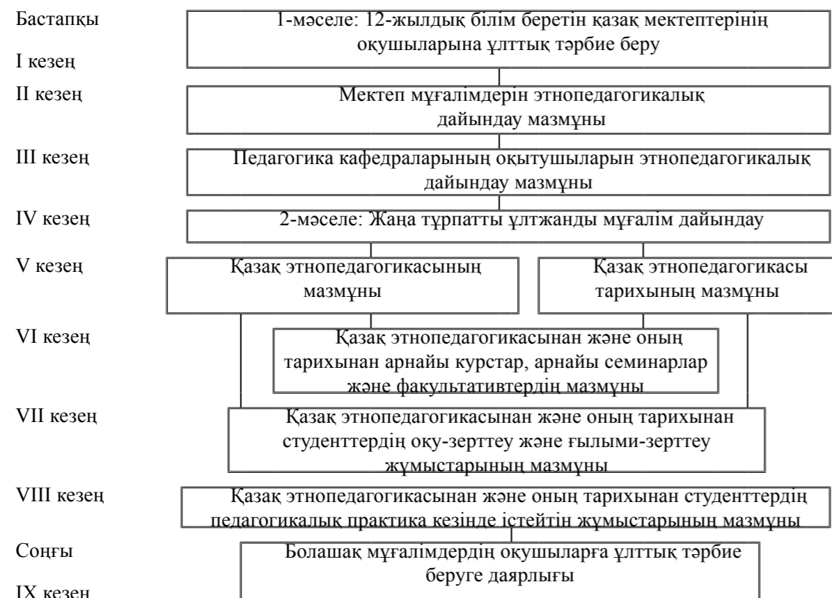
Сурет 1. Болашақ мұғалімдерді 12-жылдық мектеп оқушыларына ұлттық тәрбие беруге дайындаудың кезеңдік-мазмұндық нобайы

Тараз мемлекеттік педагогикалық институтында “Қазақ тәлім-тәрбиесі” зертханасына арнап институт ректораты шешімімен 12 x 6 м бөлме жөндеуден өткізіліп, зертхана ұйымдастырылды. Оның ішкі құрылымы үш бөлімнен тұрады.