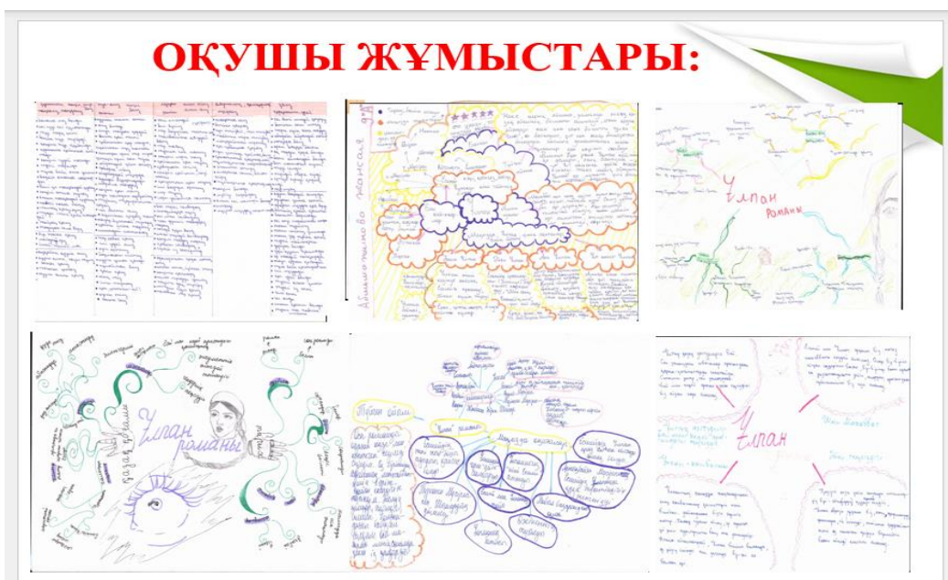
Сурет – 1.

3. Дифференциацияны қолдану. Оқушылардың деңгейіне қарай тапсырмаларды бейімдеңіз. Кейбір оқушыларға күрделі мәтіндерді талдауды ұсынсаңыз, басқаларына негізгі элементтерді анықтауға көмектесіңіз. Бұл тәсіл оқушылардың қабілеттері мен қызығушылықтарын ескеруге мүмкіндік береді. Әр оқушының жеке даму траекториясын қадағалаңыз және соған сәйкес тапсырмаларды өзгертіңіз.