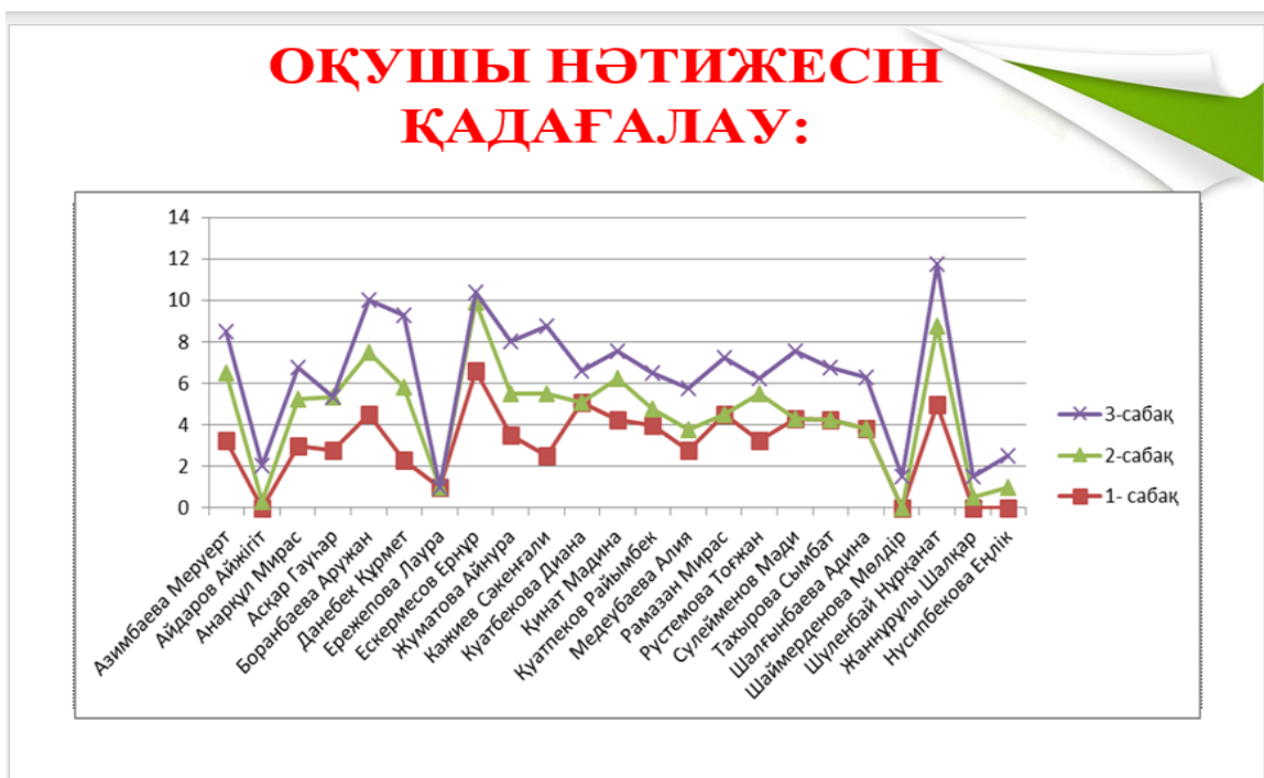
Сурет – 2.