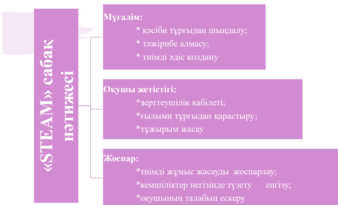
Сурет – 2